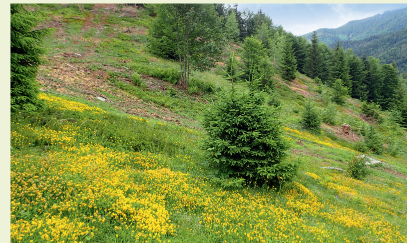
Blütenvielfalt im Schwarzwald und Offenhaltung der Landschaft durch den LEV.