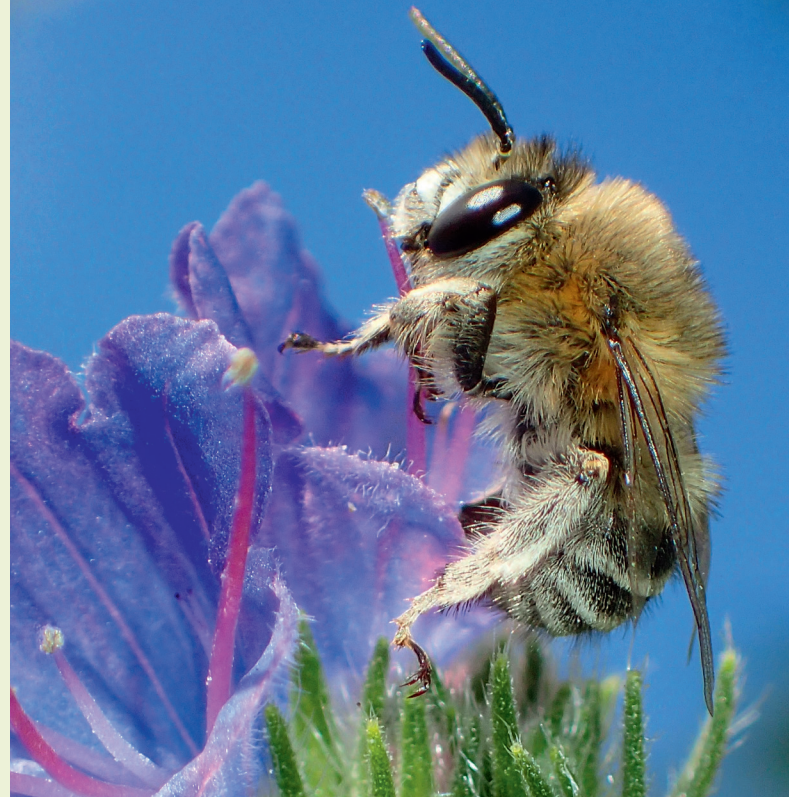
Die seltene Filzige Pelzbiene profitiert von der Rebböschungspflege – Blüten wie der Natternkopf werden gefördert.